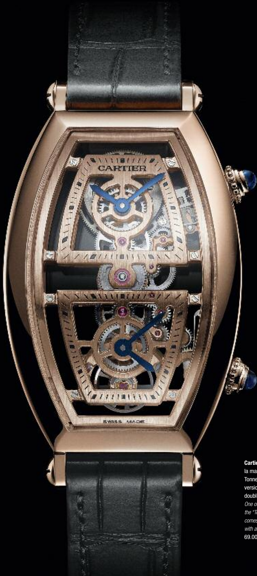
Cartier. Grand classique de la maison Cartier, la montre Tonneau se présente en version squelette avec double fuseau horaire. One of Cartier's great classics, the "Tonneau" watch now comes in a skeletonized version with a double time zone. 69.000 €.