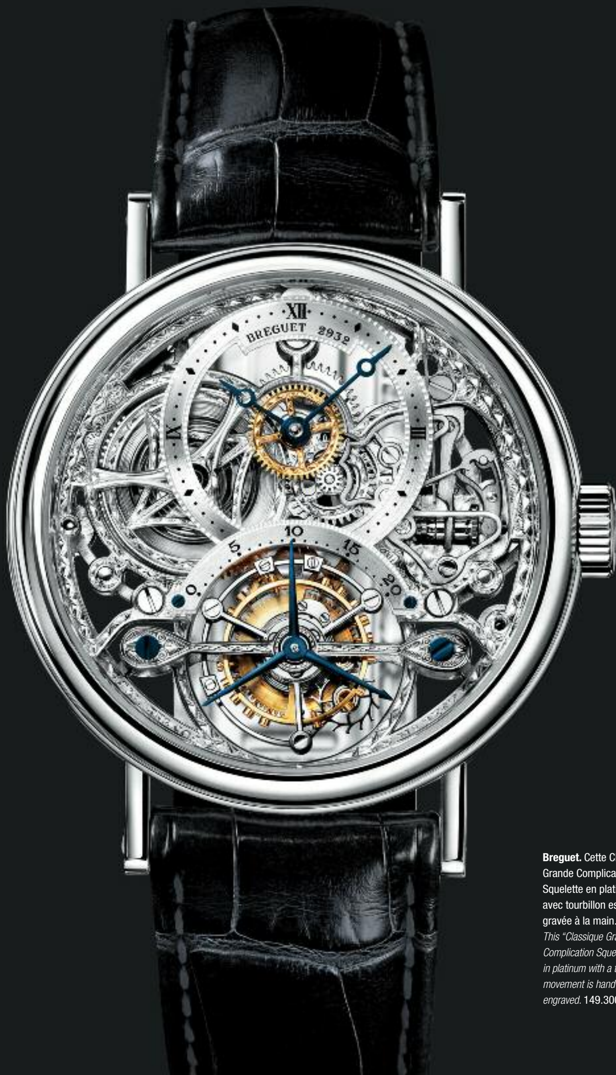
Breguet. Cette Classique Grande Complication Squelette en platine avec tourbillon est gravée à la main. This "Classique Grande Complication Squelette" in platinum with a tourbillon movement is hand-engraved. 149.300 €.